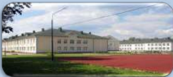
ОП «Знамя Октября»